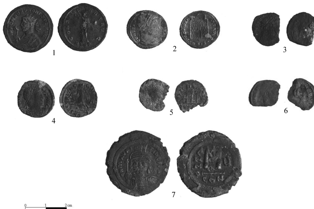
Fig. 1. Monede descoperite izolat la Sucidava în 2011.

4. AE ↑ 1,67 g, 18x19 mm. C 9, □ 1b, -1,00 m (la 0,50 m de zidul de N și 3,65 m de zidul de E al clădirii), în nivel de dărâmătură.