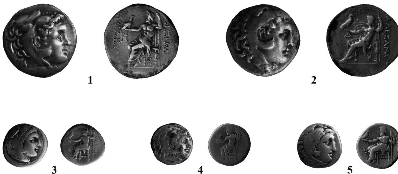
Fig. 1. Monede din tezaurul descoperit la Satu Nou, punctul „Valea lui Voicu” (com. Oltina, jud. Constanța).